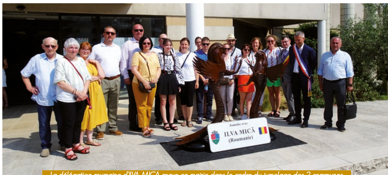
La délégation roumaine d'ILVA MICĂ reçue en mairie dans le cadre du jumelage des 2 communes