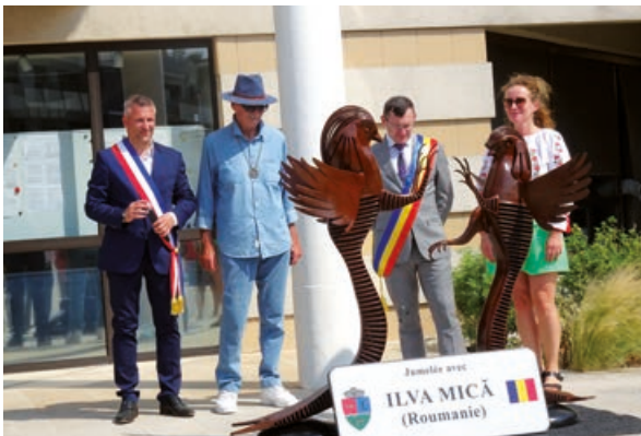
L'inauguration de l'oeuvre d'art réalisée par le sculpteur Joseph Camillert consacrant le jumelage