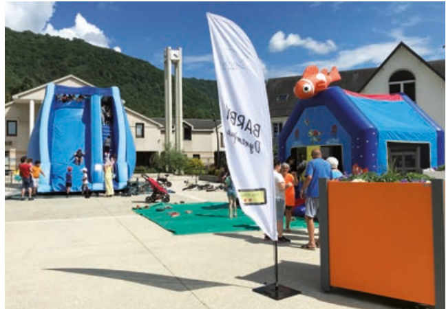
La place de la mairie transformée en aire de jeux.

En soirée, la fête s'est déplacée sur l'esplanade de la salle des fêtes avec le traditionnel repas champêtre organisé par le groupe d'animation de Barby. Cette journée s'est terminée par l'embrasement des failles.