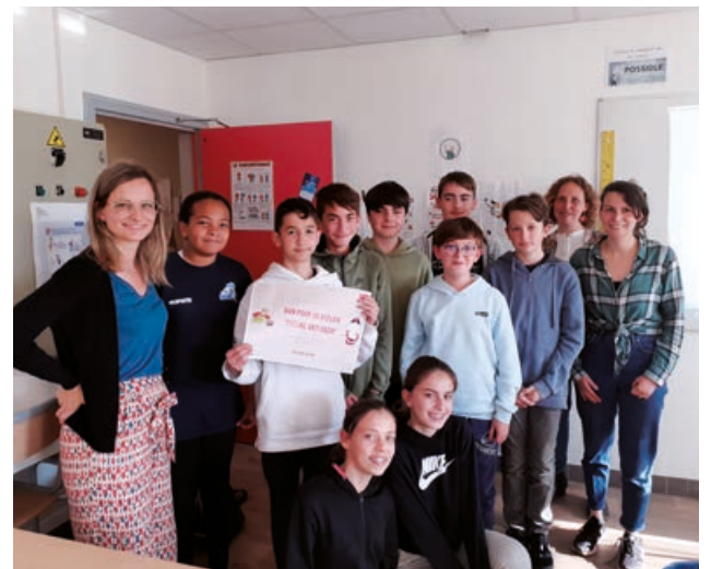
Les lauréats du concours Anti-Gaspi.