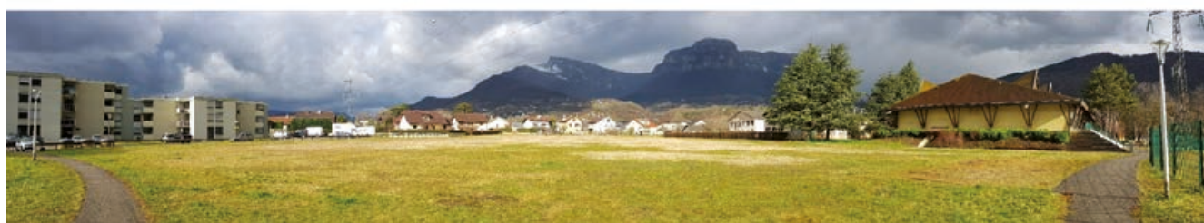
Les Épinettes et l'emplacement du futur Centre Bourg II.

Pour la seconde partie du mandat, la municipalité va enchaîner sur le projet de Centre Bourg dans sa deuxième phase, dit Centre Bourg II. Les réflexions continuent avec le groupe de concertation. La réhabilitation du quartier des Épinettes est aussi programmée avec l'office public Cristal Habitat.