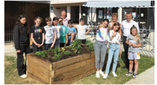
Création d'un jardin partagé place de la mairie.

Gageons que, à la suite de cette expérience municipale, ils resteront conscients de l'importance de la vie démocratique et de la nécessité de la préserver.