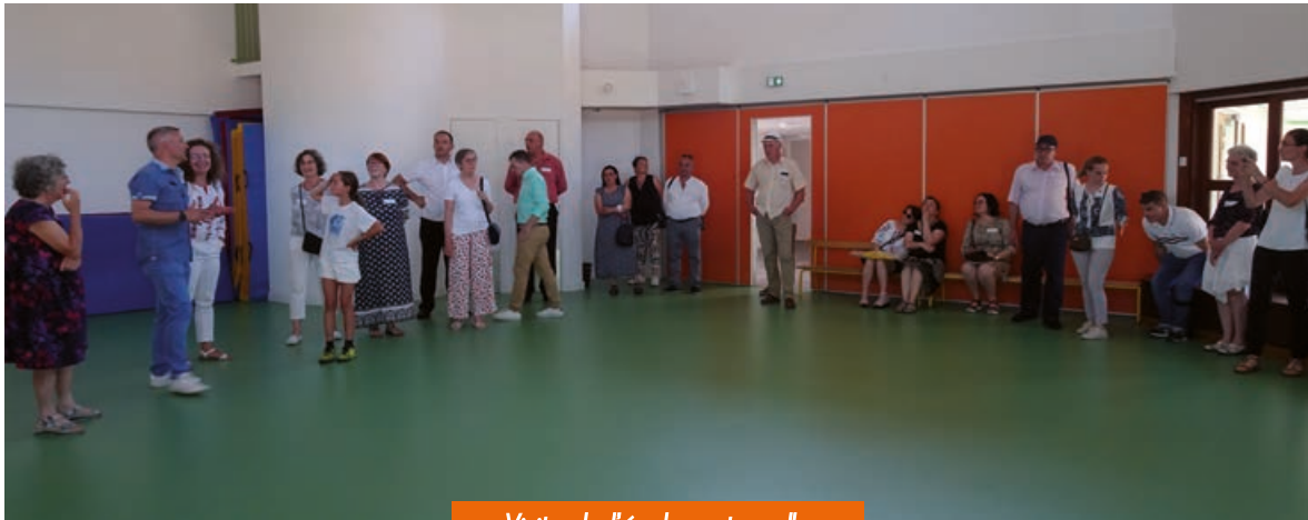
Visite de l'école maternelle