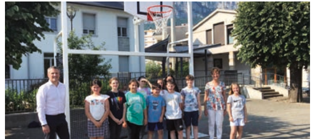
Les nouveaux équipements de la cour de l'école élémentaire.