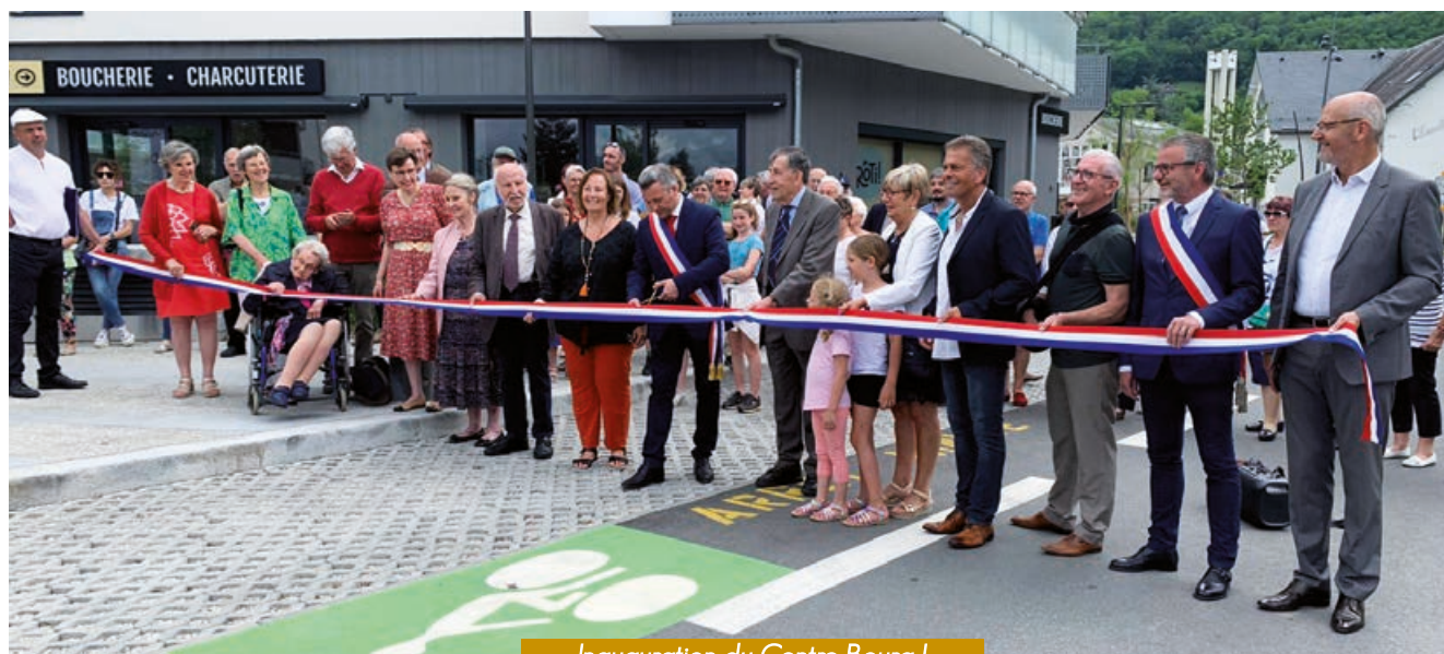
Inauguration du Centre Bourg I