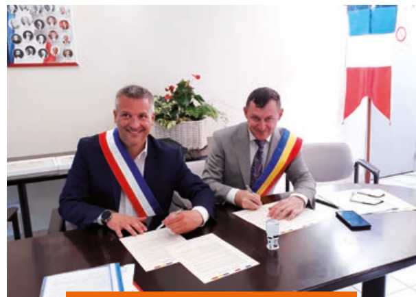
La signature du serment de jumelage