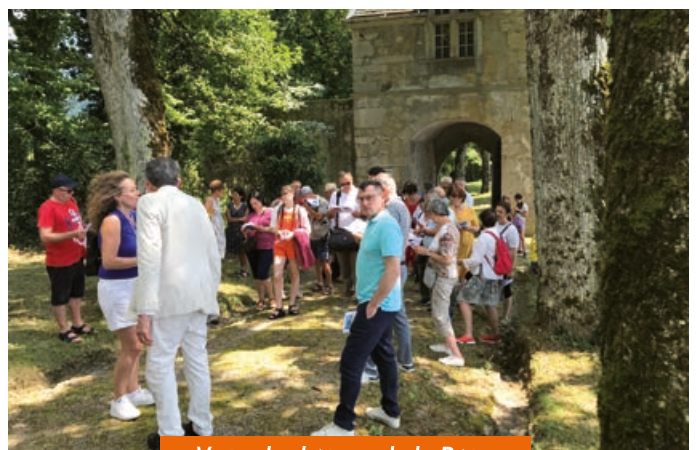
Visite du château de la Bâtie