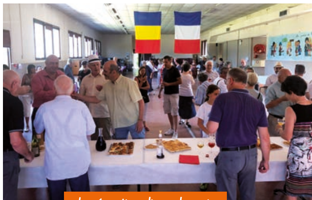
La réception dimanche soir