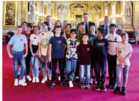
Le Conseil Municipal Jeunes en visite au Sénat.