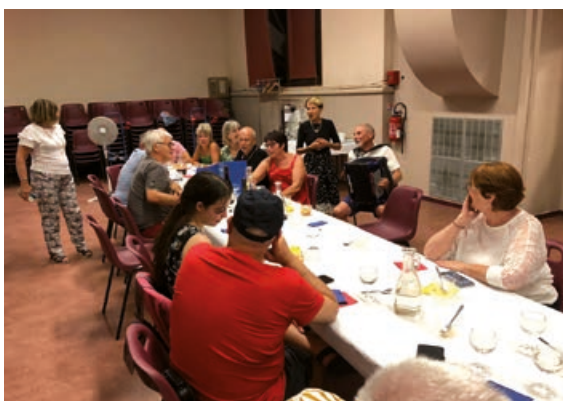
Des bénévoles assurant l'organisation des repas