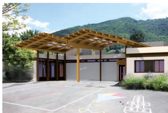
Le centre de loisirs.