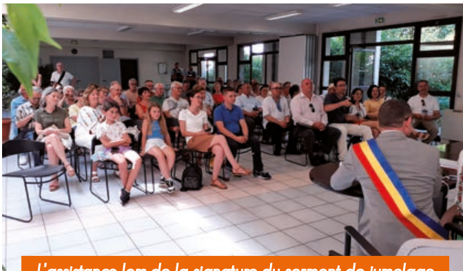
L'assistance lors de la signature du serment de jumelage