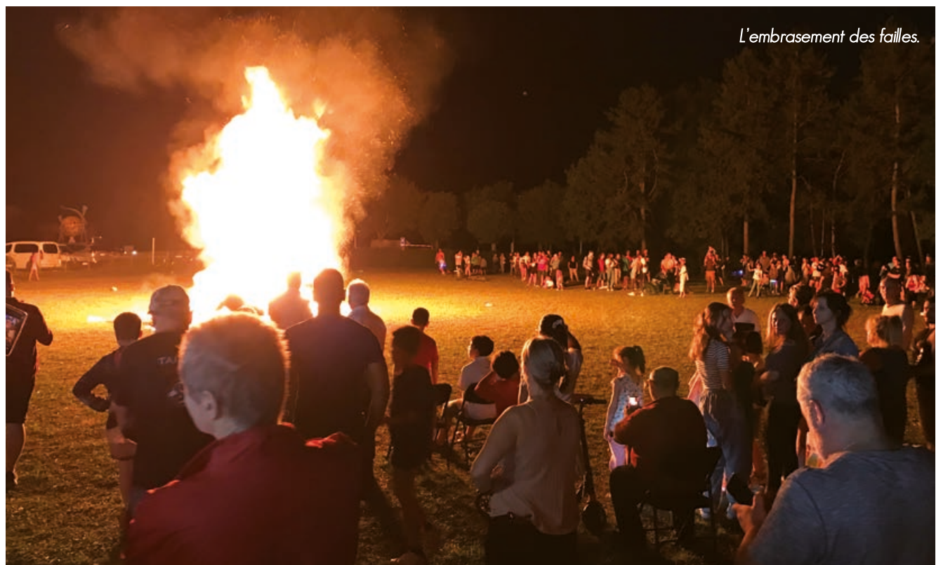
L'embrasement des failles.