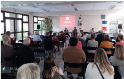
Réunion publique relative aux voiries.

Les travaux qui démarreront cet automne, sous la maîtrise de Grand Chambéry, consisteront en un réaménagement de la voirie de manière à signifier la position de la circulation vélo, avec une voie dédiée dans chaque sens de circulation. Une réunion publique a été organisée au printemps, mais nous reviendrons dans le détail sur ce réaménagement dans le prochain bulletin.