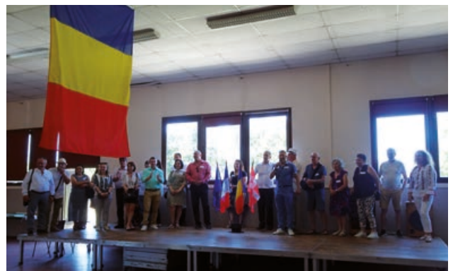
Présentation de la délégation roumaine et des élus de Barbey