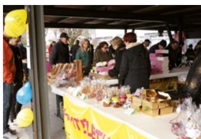
La vente des produits

Rendez-vous en décembre 2026 pour fêter les 40 ans du Téléthon !