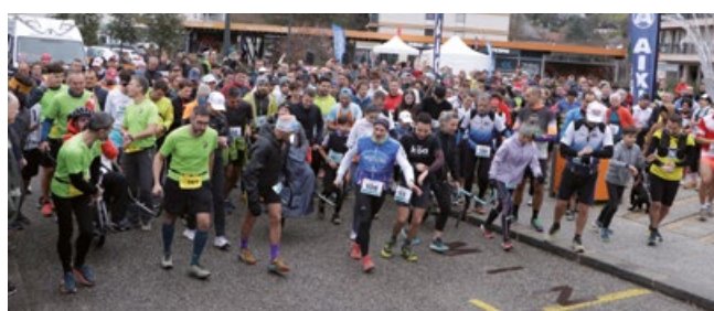
Top départ pour les coureurs