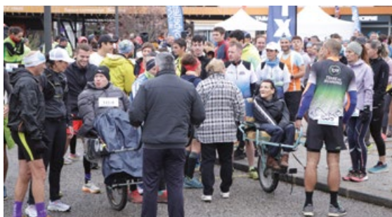
Des participants bien accompagnés