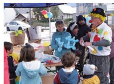
Le clown fait des heureux