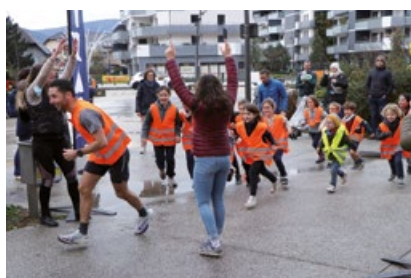
La course des enfants