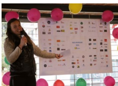
Des sponsors toujours présents