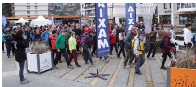
C'est parti pour les marcheurs!