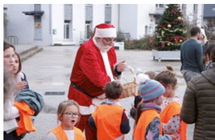
Le Père Noël sollicité