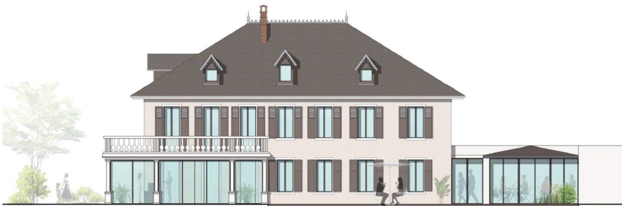
Simulation de la façade sud de l'un des porteurs de projet

Après 6 années de travail sur ce dossier, l'espoir de le voir aboutir est aujourd'hui d'actualité. Nous travaillons sur la création d'un restaurant, de chambres d'hôtel, d'un salon de thé. Ce projet correspondrait à nos attentes.