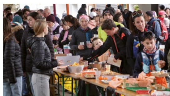
Le réconfort après l'effort