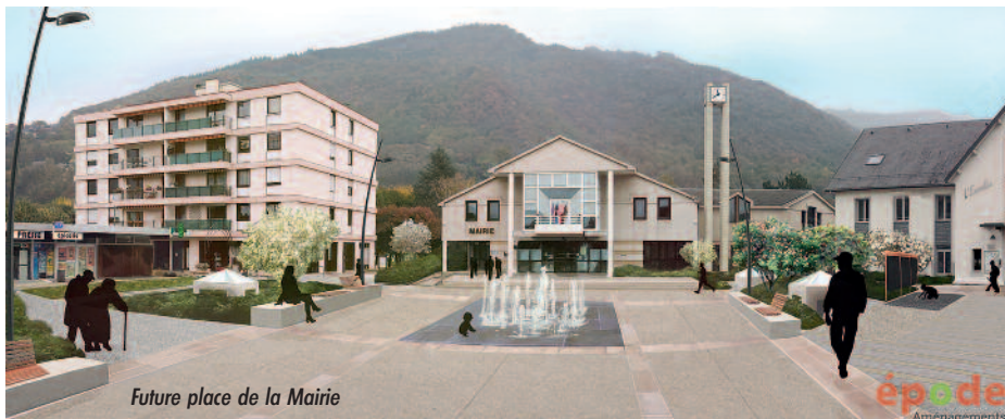
Future place de la Mairie