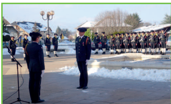
Remise de fourragère au 13 ème BCA sur la place de la Mairie