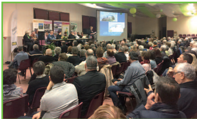
Vœux du Maire à la population