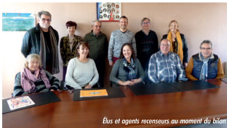
Élus et agents recenseurs au moment du bilan

La population n'a augmenté que de 241 habitants (hors 13 ème BCA) pour 302 logements supplémentaires, soit 16 habitants de plus par an en moyenne sur la période.