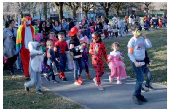
Carnaval du Centre de loisirs