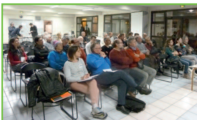
Conférence sur la transition énergétique - négaWatt