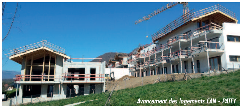
Avancement des logements CAN - PATEY

Pour les 11 lots libres de maisons individuelles, 7 sont vendus ou en cours. Il ne reste donc que 4 terrains à vendre (contacter la SAS en cas d'intérêt).