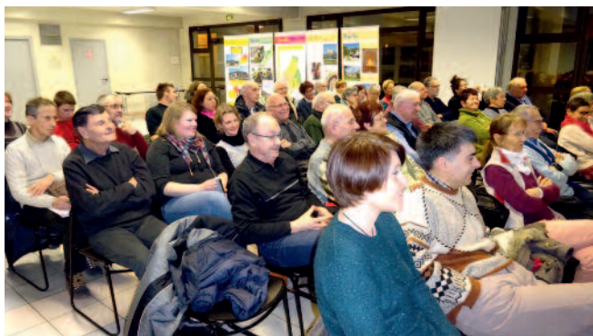
Vœux aux associations

En ce début de printemps, je vous invite à participer, toujours plus, à tous ces événements pour cultiver, faire grandir et fleurir de belles relations humaines, ciment de notre société.