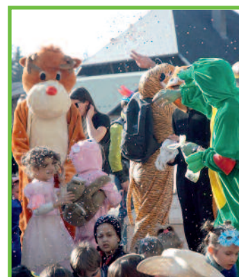
Carnaval au Centre de loisirs