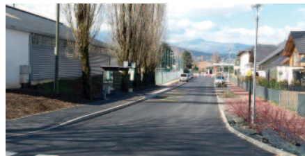
Aménagement de la rue du Champ de Mars

Clos des Corti : Une nouvelle aire de jeux a été réalisée en février/mars dans l'espace vert central du lotissement. Réalisée en robinier faux acacia (bois massif) et avec des copeaux de bois au sol pour l'amorti (sans recourir aux sols souples en billes de caoutchouc recyclé), elle sera mise en service courant avril.