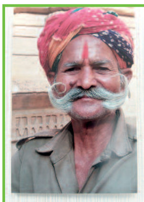
Exposition photos sur le Rajasthan par B. Moreaux