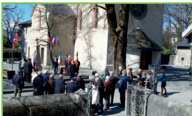
Commémoration du cessez-le-feu en Algérie