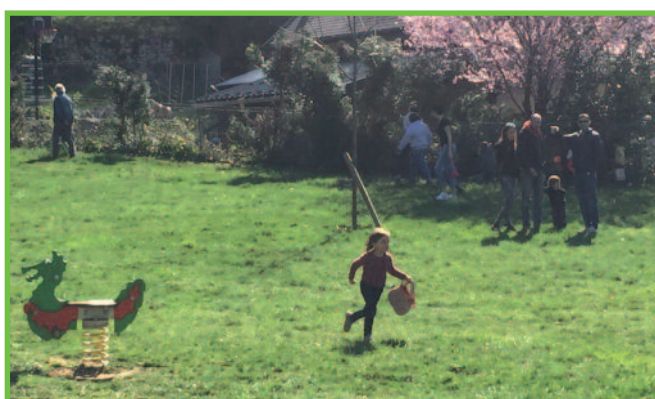
Chasse aux œufs avec le « Trésor des Écoles »