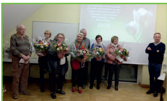
Remise des prix pour le fleurissement et les illuminations