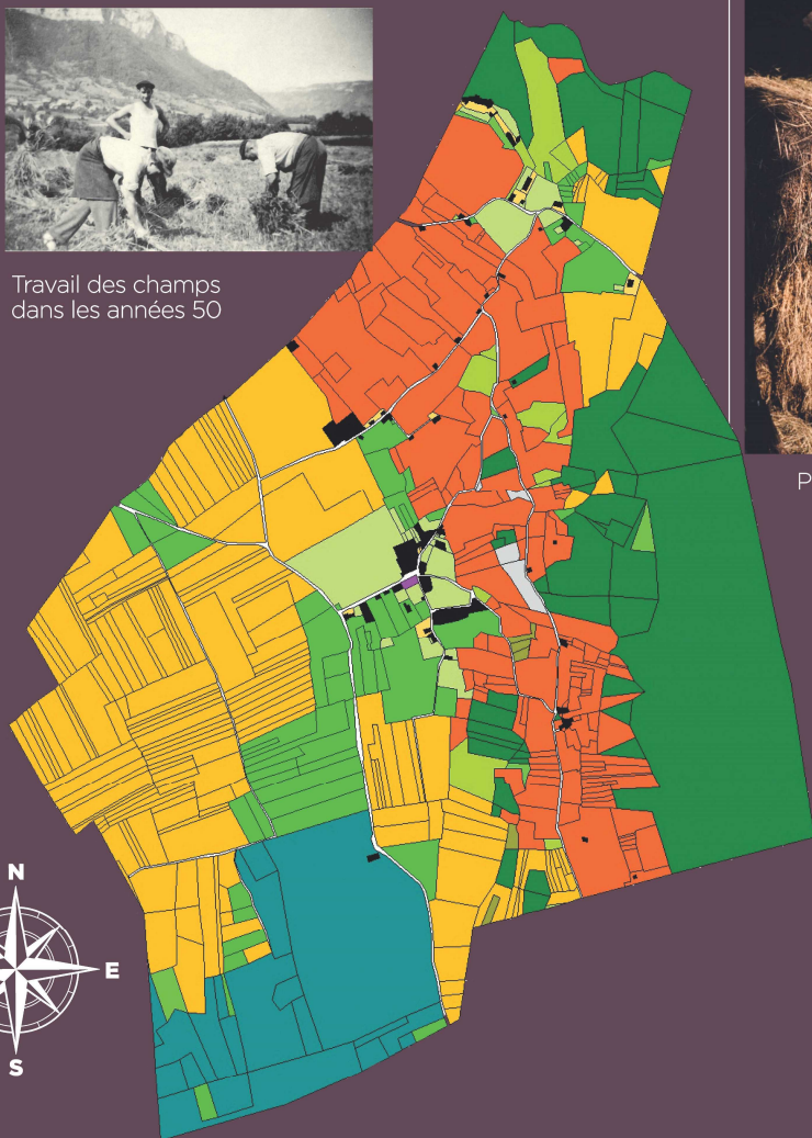
Cartographie du cadastre de 1730 Réalisation Dominique Barbero