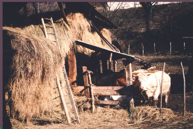
Propriété Antoine Coutaz, rue du village

À 400 pas sur votre gauche, en montant dans un pré se trouvent les soubassements d'un ancien cellier.