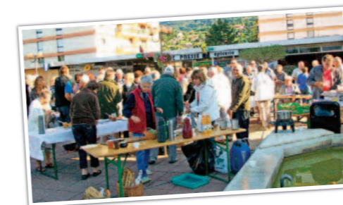
→ Petit-déjeuner du GAB