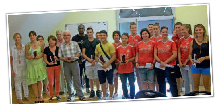
→ Remise des trophées associatifs 2015