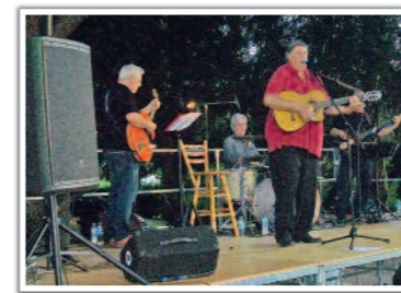
→ Concert au Parc Malatray

Page 2. La rentrée scolaire 2015 - 2016 Le centre de loisirs Les Mouettes Page 3. Travaux Familles à énergie positive Voyage à Ilva Mica Page 4. Infos diverses Agenda