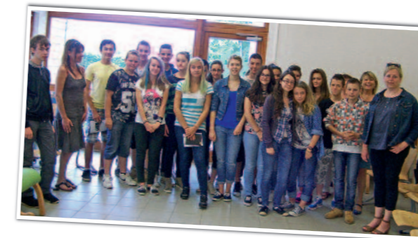
→ Un auteur au collège Jean Mermoz