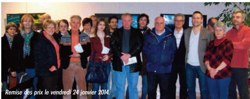
Remise des prix le vendredi 24 janvier 2014.