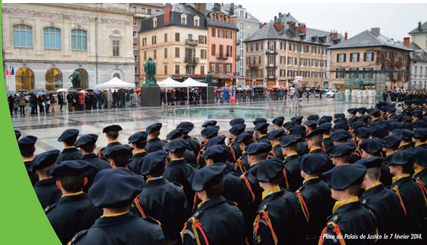
Place du Palais de Justice le 7 février 2014.

Cette opération fait suite à la manifestation qui a eu lieu le vendredi 7 février 2014 sur la place du Palais de Justice à Chambéry à l'occasion de laquelle ont notamment été remises des fourragères aux militaires ayant terminé leur formation initiale.