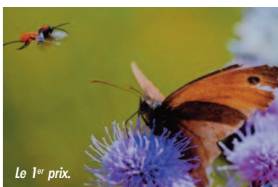
Le 1 er prix.