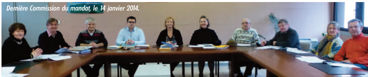
Dernière Commission du mandat, le 14 janvier 2014.

Aux termes de l'article 1650 du Code Général des Impôts, il est institué, dans chaque commune, une Commission Communale des Impôts Directs. Elle est composée de 9 membres, soit : le Maire ou l'Adjoint délégué, Président et de 8 commissaires. Les Commissaires ainsi que leurs suppléants en nombre égal sont désignés par le Directeur des Services Fiscaux sur une liste de contribuables, en nombre double, dressée par le Conseil Municipal.