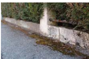
Réduire l'impact environnemental du désherbage, c'est aussi accepter quelques herbes folles (ex-mauvaises herbes).

Afin de réduire la pollution des étendues et des cours d'eau, le CISALB (Comité Intersyndical pour l'Assainissement du Lac du Bourget) a proposé aux communes de s'engager dans une démarche environnementale visant à limiter l'utilisation des pesticides. Avec l'aide technique et financière du Conseil Général et de l'Agence de l'eau, 3 niveaux d'engagements sont possibles: