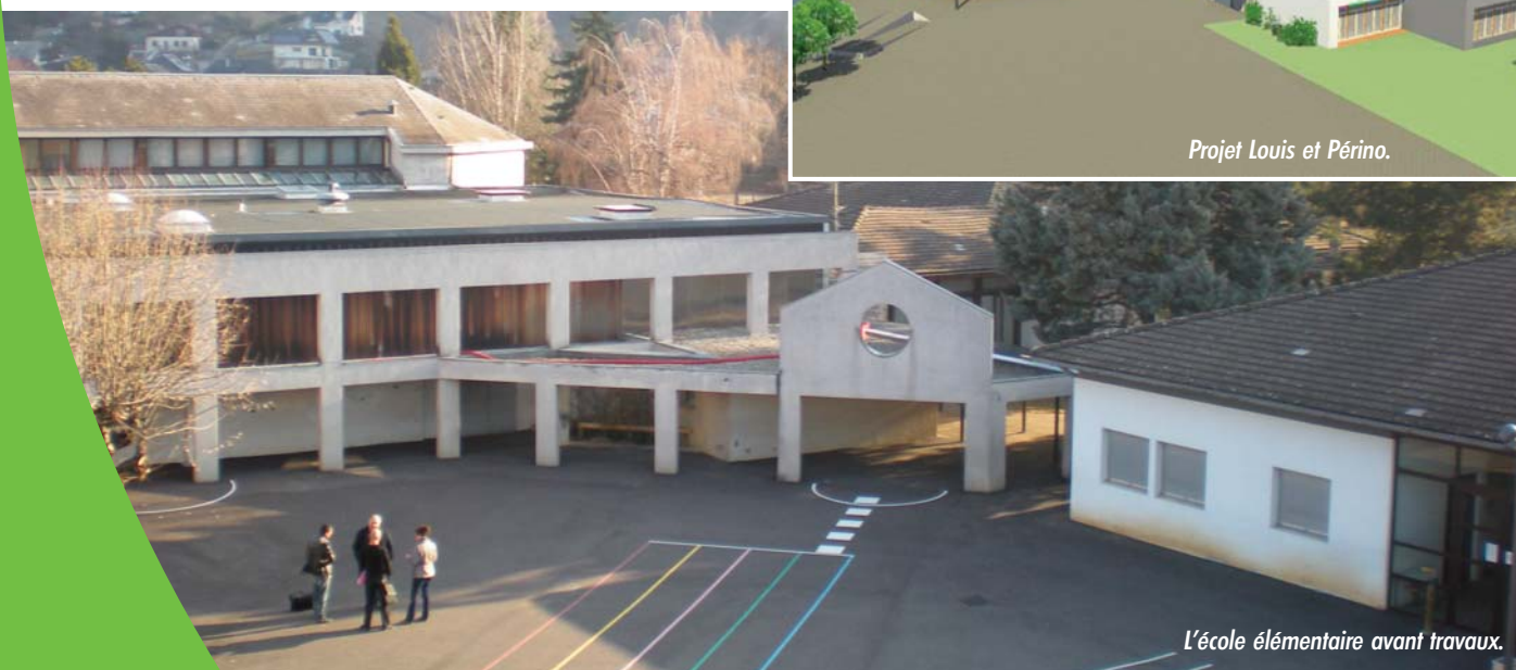
L'école élémentaire avant travaux.