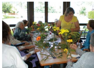
L'atelier d'art floral