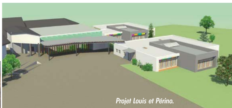
Projet Louis et Périno.

presque trois ans et demi qui seront nécessaires pour transformer l'établissement et l'adapter aux besoins de nos aînés. Dix studios modernes de foyer logement seront d'abord créés, avec chambre séparée. Ensuite l'ancien immeuble sera entièrement mis aux normes de sécurité, les espaces communs seront rénovés et surtout les trois niveaux, rez-de-chaussée, 1 er et 2 ème étage seront transformés pour offrir des locaux totalement adaptés aux besoins de nos aînés les plus en difficulté (ouvertures de portes, salles de bain, espaces pour personnes souffrant d'Alzheimer ou de maladies apparentées). Tout sera mis en œuvre pour que ce chantier perturbe le moins possible le quotidien de nos résidents. C'est donc un défi majeur à relever