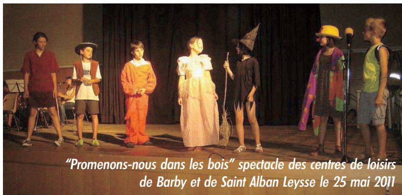
"Promenons-nous dans les bois" spectacle des centres de loisirs de Barby et de Saint Alban Leysse le 25 mai 2011

Pour tous renseignements, contactez Anne-Sophie au centre de loisirs de Barby ou au 0479713155 Les lundis et mardis de 16 h à 18 h et les mercredis de 17 h à 18h30