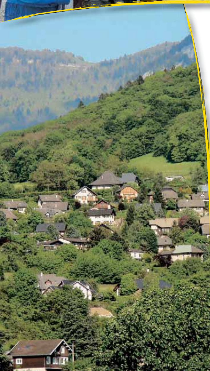
Quartier de la Bâtie.