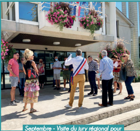
Septembre - Visite du jury régional pour le Label 3 ème fleur