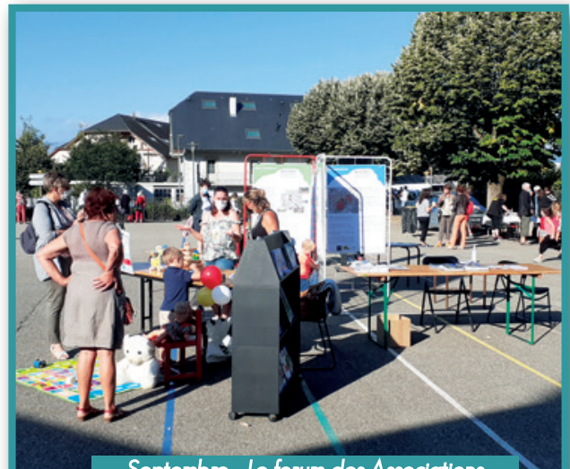
Septembre - Le forum des Associations