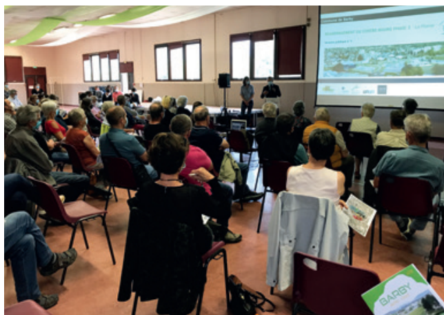
Réunion publique de lancement de la concertation - 8 juin

Au début du mois de juin s'est tenue à la salle des fêtes une première réunion de présentation du Centre Bourg II . Ce projet d'urbanisme se fera dans la continuité du Centre Bourg I et concernera le plateau sportif, les tennis, la salle des fêtes, le stade d'honneur et les abords des Epinettes. La mairie a décidé de conduire ce dossier en concertation avec les Barbysiens. Les élus, assistés par les agences AGATE et ATELIER 2 ont exposé les enjeux et contraintes de l'opération. Quatre ateliers tournants ont été animés, portant chacun sur une thématique définie : Déplacement, Habitat, Équipements et Espaces Publics. Les habitants ont pu exprimer leur ressenti, exposer leurs attentes sur les différents thèmes. Ces quatre thèmes sont désormais présentés dans le hall de la mairie, vous pouvez renseigner un registre ou écrire des « post-it » avec vos souhaits, idées ou remarques. Toutes les observations seront étudiées avec attention.