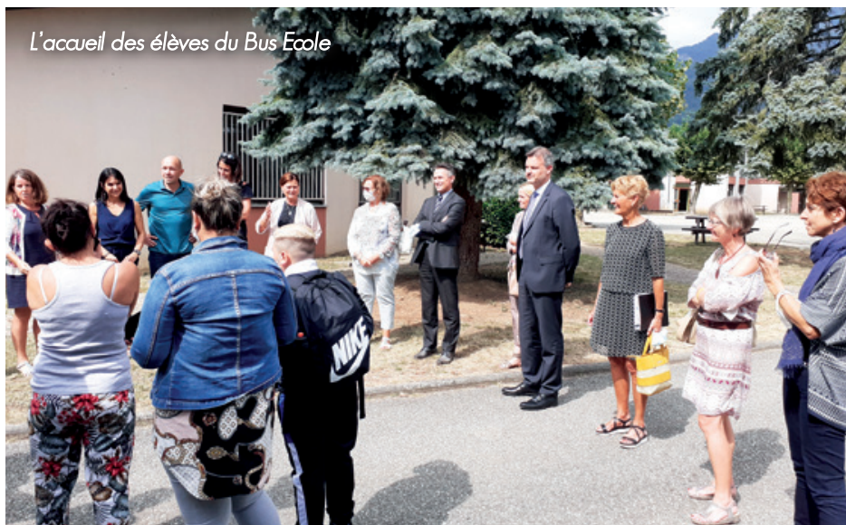
L'accueil des élèves du Bus École

Les 425 élèves de 5ème, 4ème et 3ème ont fait leur rentrée vendredi 3 septembre.