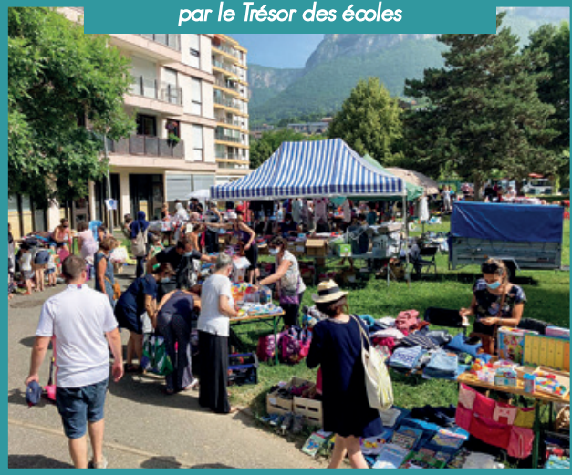
Juin - La braderie des enfants organisée par le Trésor des écoles