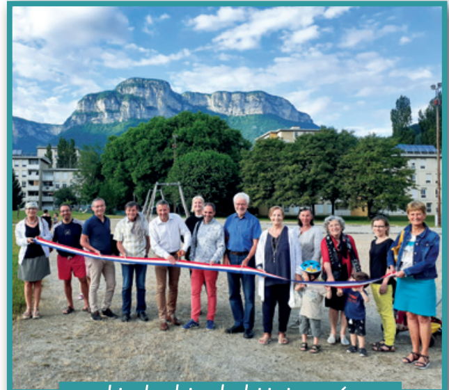
Juin - La plaine des loisirs inaugurée