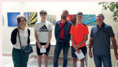
Les jeunes barbysiens entourés par leurs éducateurs

et le service de prévention spécialisée de la « Sauvegarde de l'Enfance et de l'Adolescence des Savoie », le dernier chantier s'est terminé fin juillet par la réception des travaux. Les jeunes, sous la responsabilité de l'éducatrice, ont repeint les lisses en béton de la rue du Prédé, devant le cimetière et au-delà. Une petite partie restant à peindre, cela fera l'objet d'un prochain chantier en 2022. Ces chantiers permettent à de jeunes barbysiens de vivre une première expérience professionnelle et de contribuer à l'entretien de la commune par des travaux de peinture, de petite rénovation... ce qu'apprécient les habitants.