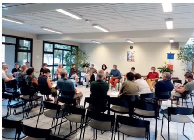
Réunion du groupe citoyen - 29 juin

Dans cet esprit de concertation un groupe citoyen a été constitué et s'est mis en place au début de l'été. Composé à ce jour de 25 habitants volontaires il a pour mission de réfléchir, débattre, proposer des idées nouvelles et ainsi d'apporter aux élus des éléments éclairant leur prise de décision. Ce groupe reste ouvert à tous les Barbysiens souhaitant apporter leur pierre à l'édifice.