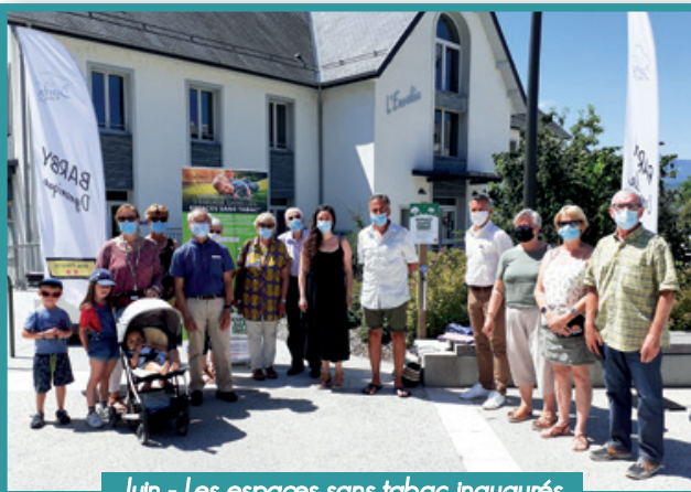
Juin - Les espaces sans tabac inaugurés